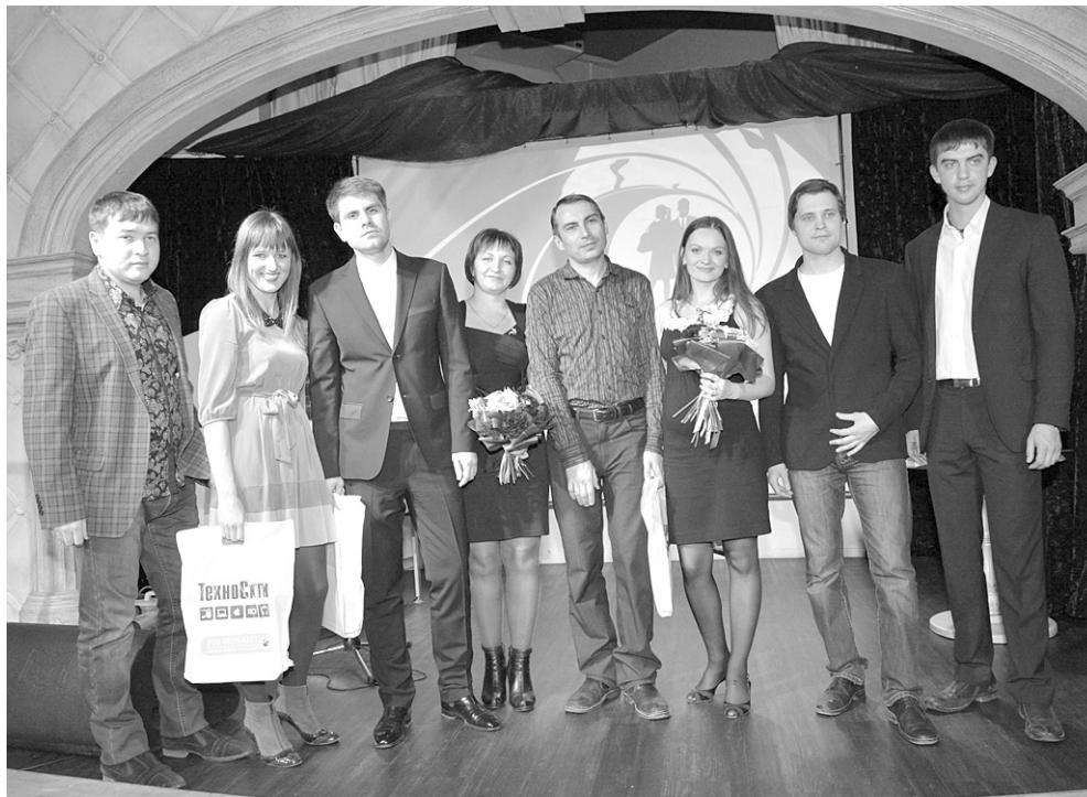
На сцене — победители в номинациях.