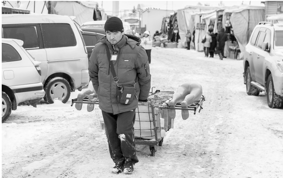
1 января 2014 года такой пережиток прошлого, как барахолка, прекратит своё существование.

Однако, несмотря на все предпринимаемые действия мэрии, часть продавцов не желает принимать к сведению очевидный факт, что барахолка будет закрыта, становясь объектом ма-